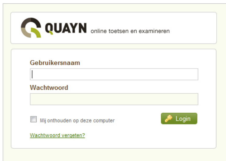
Figuur: Het inlogscherf van de Quayn Portal.