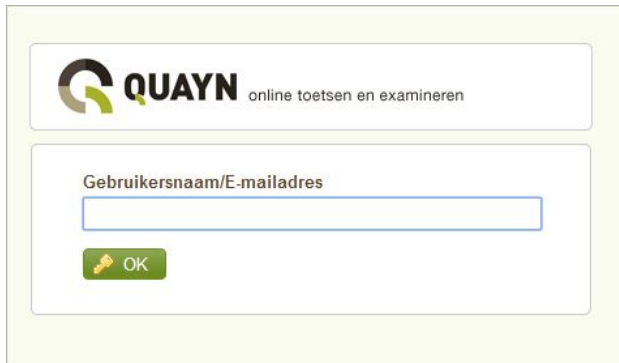
Figuur: Dit scherm verschijnt na het aanklikken van 'Wachtwoord vergeten?'.

Er wordt een nieuw wachtwoord verstuurd naar uw E-mailadres. U kunt met dit nieuwe wachtwoord inloggen.