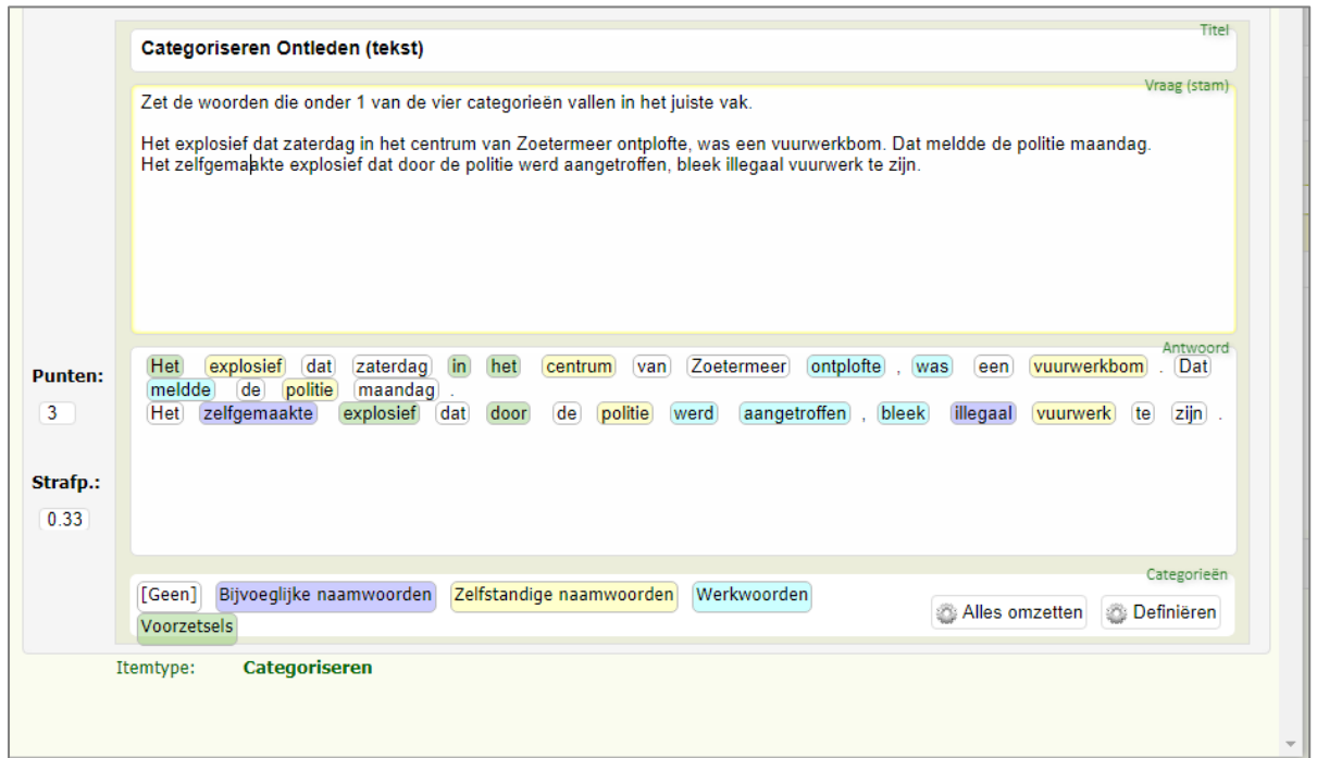
Figuur: De categoriëervraag met woorden gekoppeld aan een categorie.

U komt in een venster waar u de categorieën die u wilt gebruiken kunt aanmaken.